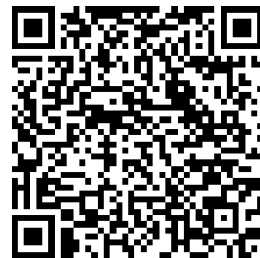
参加登録用 Google フォーム